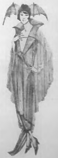
Traje representando el "Mardi Gras" típica de tono negro con copa y alas de ganso.