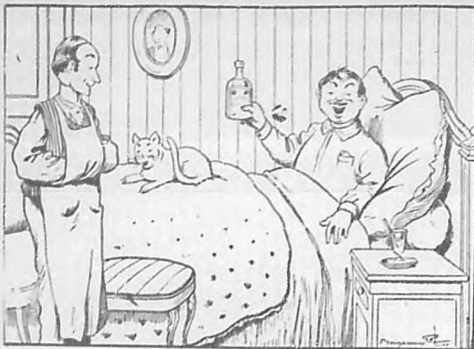
El señor padece una bronquitis, voy a buscarle algún medicamento. No le moleste, amigo Baulista, no necesito más que el Alquitran Guyot.

El empleo del Alquitran Guyot tomado en todas las comidas a la dosis de una cucharada de café en un vaso de agua, basta, efectivamente, para hacer desaparecer en poco tiempo el catarro más pertinaz y la bronquitis más inveterada. Incluso consiguese a veces modificar y curar la tisis bien declarada, puesto que el Alquitran define la descomposición de los tuberculos del pulmón, matando los microbios nocivos causantes de esta descomposición. En interés de los enfermos debo manifestar desconfiarse de cualquier producto que se les quiera vender en lugar del verdadero Alquitran Guyot. Para obtener la curación de las bronquitis, catarros, antiguos resfriados descuidados y a fortiori el asma y la tisis, es indispensable pedir en todas las farmacias el verdadero Alquitran Guyot. Con objeto de evitar todo error mirad la etiqueta; la del verdadero Alquitran Guyot lleva el nombre de Guyot impreso en gruesas caracteres y su firma al biés en tres colores: violeta, verde y rojo, lo propio que la dirección: Maison E. Frere, 19, rue Jacob, París. El tratamiento viene a costar unos 10 centimos al día; y no obstante cural!