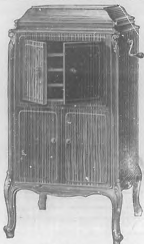
VICTROLA 107. $275.00.

NUEVOS ESTILOS ACABAMOS DE RECIBIR LOS MODELOS DEL AÑO 1925 PREPARADOS PARA ADAPTARLES APARATOS DE RADIOTELEFONIA. ELEGANTES, PERFECTOS, ECONOMICOS. DISTRIBUIDORES GENERALES.