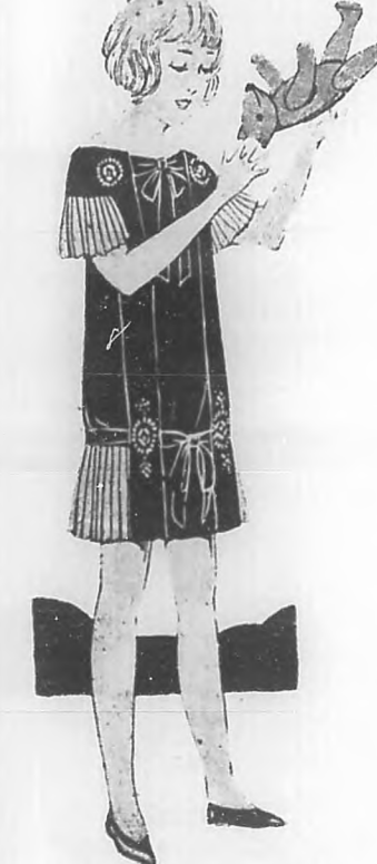
Lindo modelo de terciopelo azul oscuro, con vuelos plisé color arena.