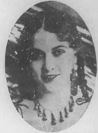
"LUPE" RIVAS CACHO La bella y graciosa tiple mexicana que reaparecerá en "Payret" en próximo martes.

Para el sábado está anunciada en cartel "Cuerdos y locos", sainete de Agustín Roqué, que tiene muchísima gracia.